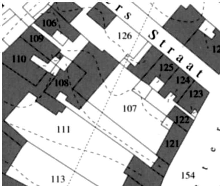
Het claustrale erf op het kadastraal minuutplan van 1832, omvattend de nummers Gemeente Utrecht, Sectie B, nummers 106, 107, 108, 109, 110, 121 en 122. Het grootste deel van het voormalig claustraal huis behoorde tot nummer 107. Tekening ontleend aan Utrecht in 1832, plattegrond nr. 32.